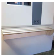
Support pour sacs