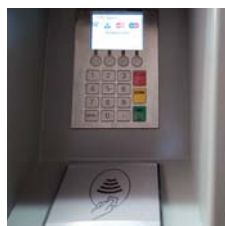
Traitement de carte de crédit sans contact