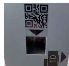
Scanner de code QR pour smartphones ou bons d'achat