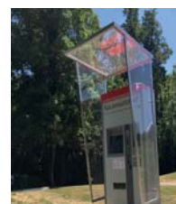
Auvent en acier inoxydable, fixation à la caisse